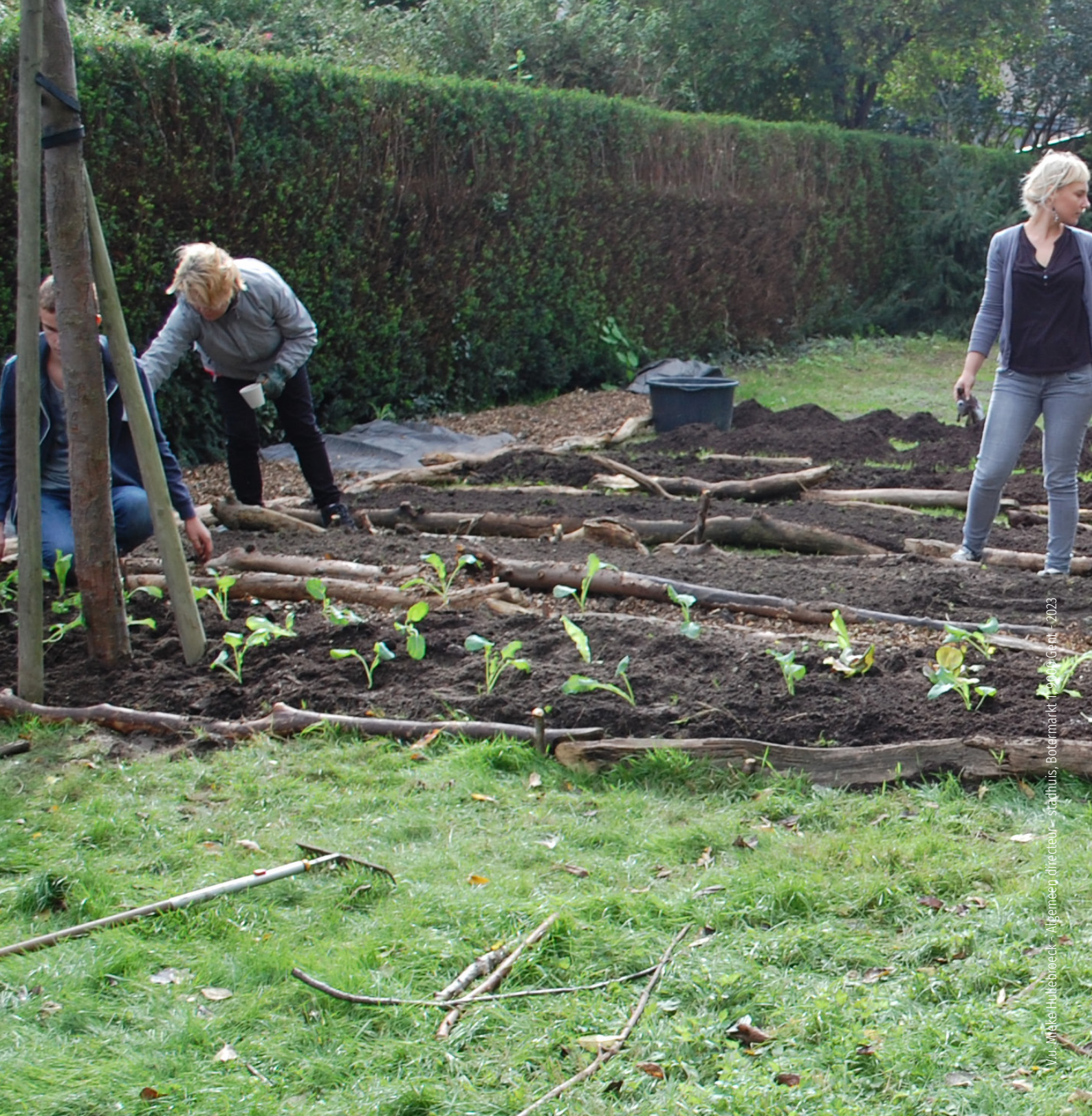
V.v. Make Hultebroek - Algemeen directeur - Stadhuis, Botermarkt 11-9000 Gent - 2023